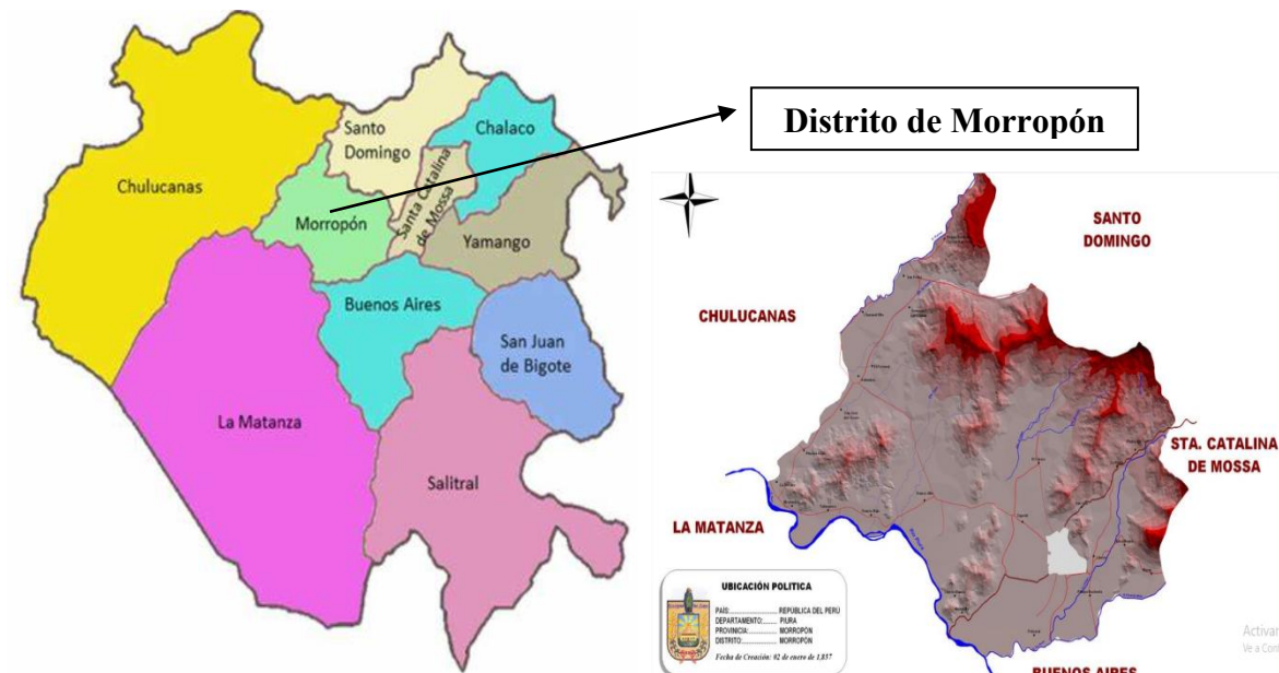
FIGURA N°2. Provincia de Morropón

Ubicación de Morropon en el mapa del Piura - Búsqueda Imágenes (bing.com)